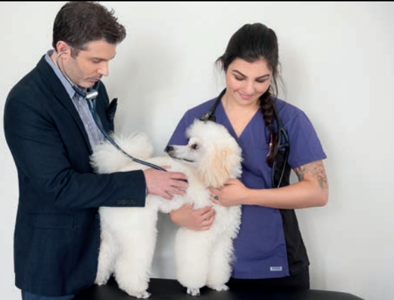
Consultation à l'interne